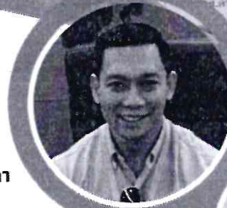
ศ.ดร.อรรพพล ควรเลี้ยง